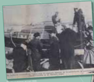
2. Photo France 45 oct 1958

Une information contre X pour homicide involontaire est ouverte par le procureur de Lorient. Des interrogatoires des victimes, des acteurs et des témoins du drame sont menés, pour déterminer le degré de responsabilité de chacun. Mais les enquêtes, judiciaire et maritime, sont abrégées et personne ne porte plainte. (III. 2 et 3)