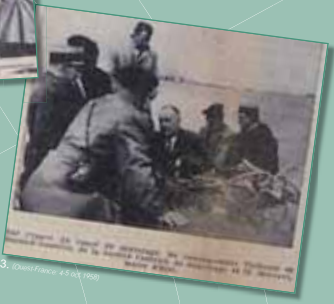
3. Photo France 45 oct 1958