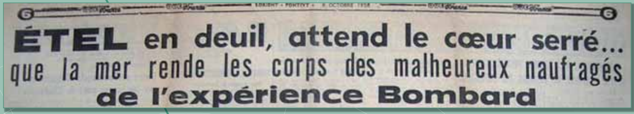
1. Photo France 44 oct 1958