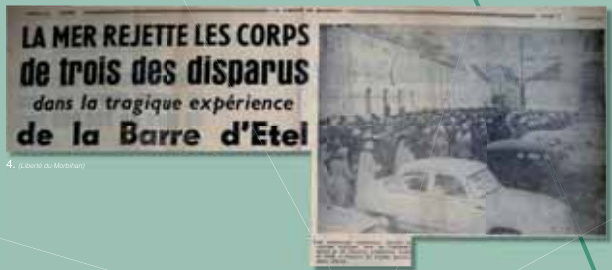
4. Photo du Morbihan