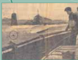
9. Remorqueur s'approchant du canot de sauvetage retourné (Ouest-France - 4-2 fév 1958)