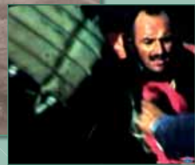
2. Beauvais dans le radeau