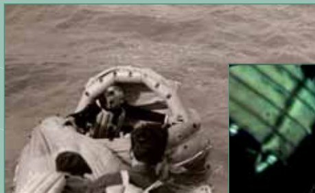
1. Beauvais dans le radeau