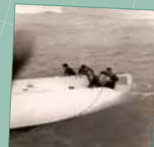
10. Rescapés sur la coque (Ouest-France - 1-7 juin - Musée de Lorient)